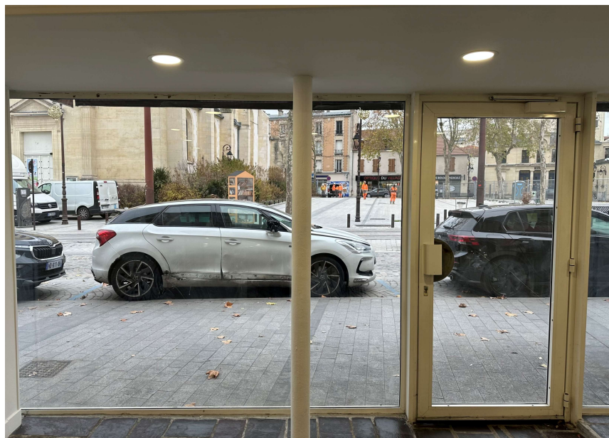
Vitrine toute hauteur et toute largeur