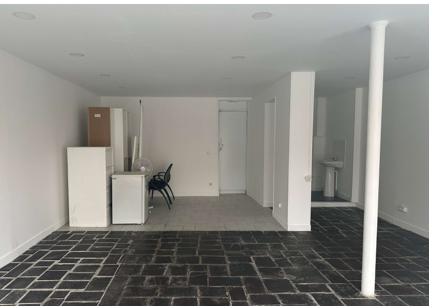
Espace principal cloisonné avec lavabo en retrait

Utilisation récente du local pour une boutique éphémère entre le 12 déc. 2025 et le 3 janvier 2026