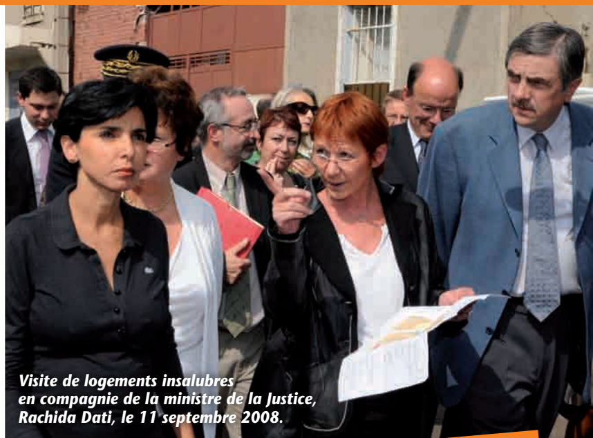
Visite de logements insalubres en compagnie de la ministre de la Justice, Rachida Dati, le 11 septembre 2008.