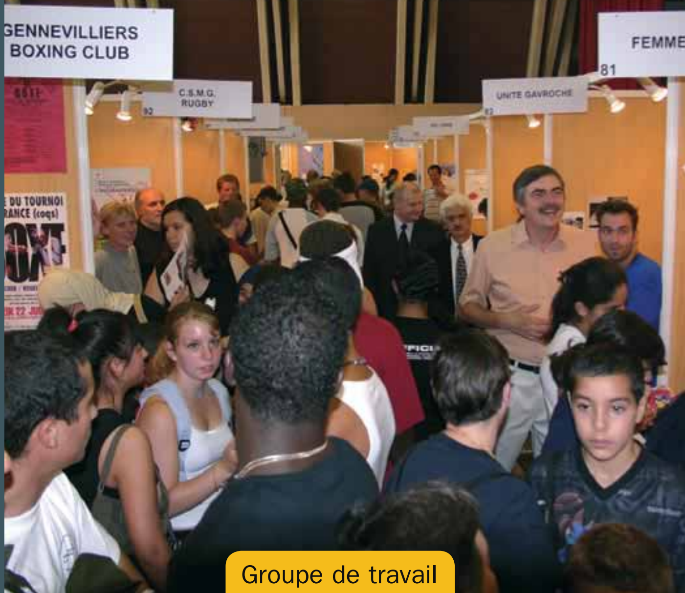
Groupe de travail