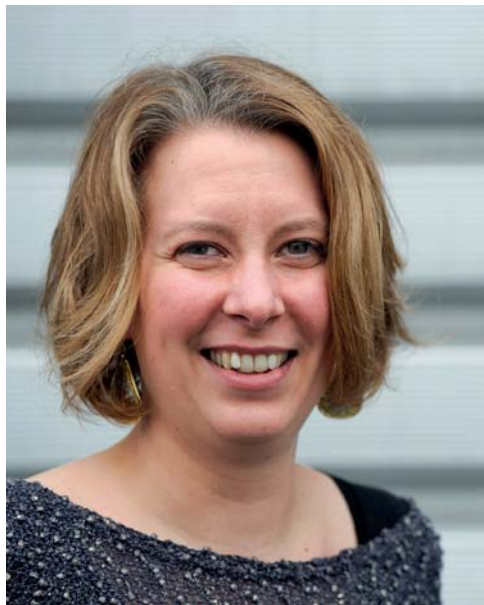
La Table de Cana Julie Doizy